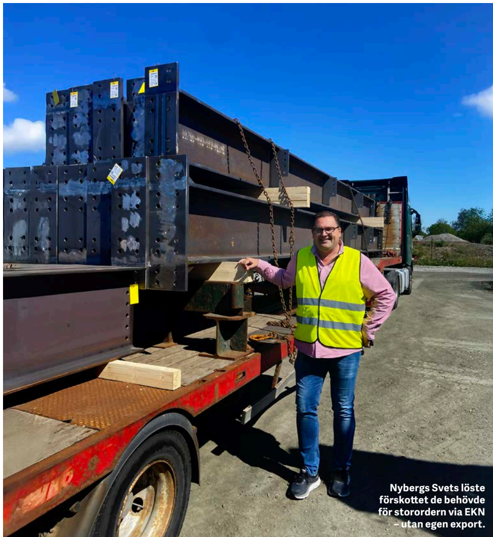
Nybergs Svets löste förskottet de behövde för storordern via EKN – utan egen export.